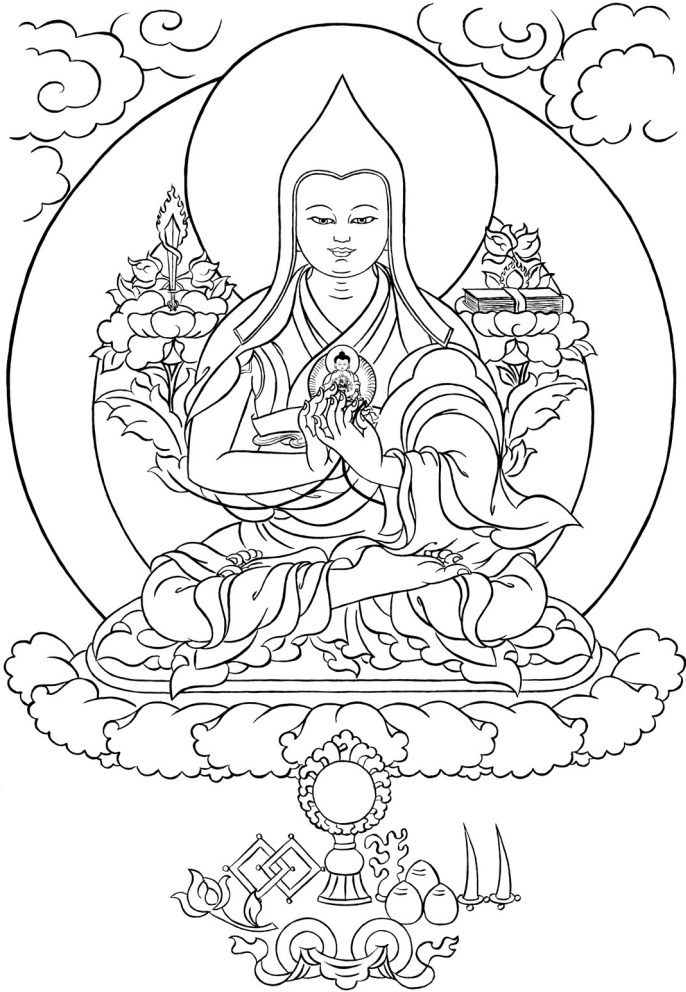
Guru Sumati Buda Heruka