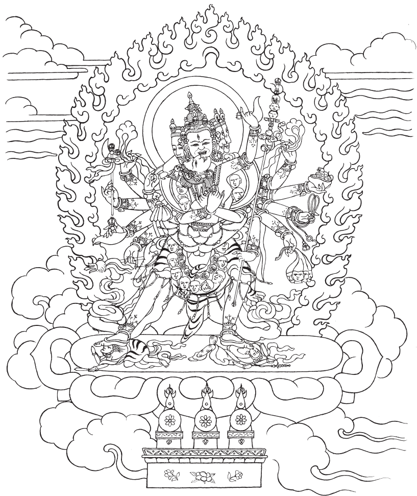
Heruka de doce brazos