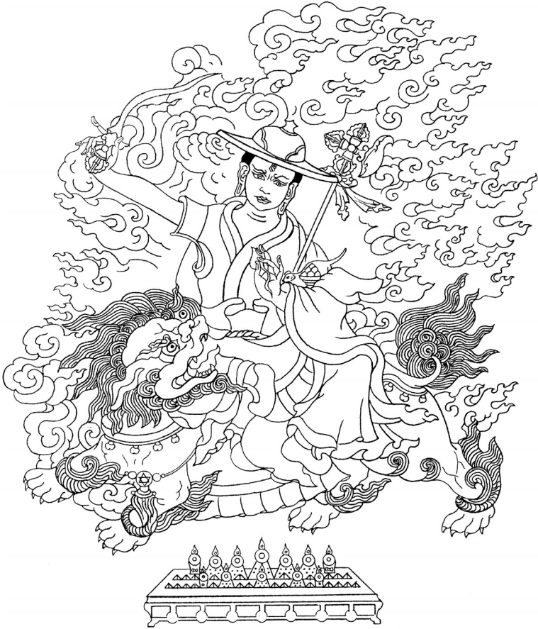
Protector de Sabiduría del Dharma